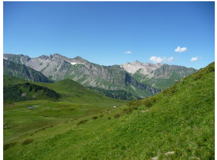
Blick zum Obersäss und zum Moor beim Ruchenberg