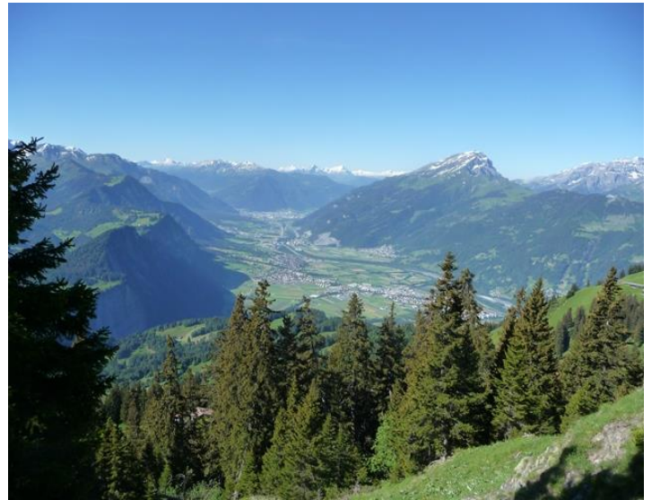
Beim Abstieg nach Valcaus, Blick Richtung Chur und Calanda