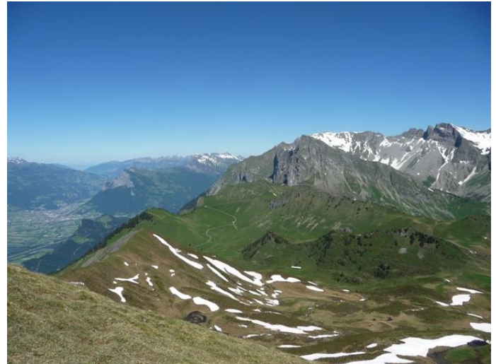
Frühsommer-Blick vom Vilan ins Sarganserland und zum Falknis