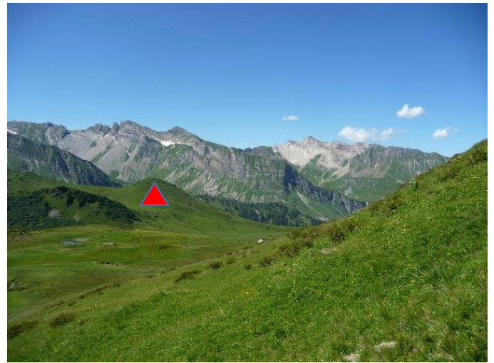
Der Zuckerstock ▲ präsentiert sich als aussichtsreicher Punkt.