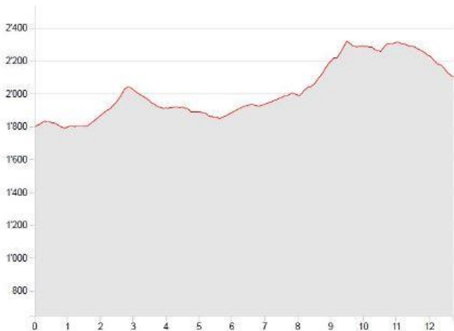
Anmerkung: Profil und Route vom Äpli bis Pfälzer Hütte