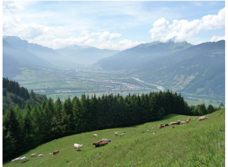
Blick beim unteren Heuberg ins Rheintal und zum Calanda