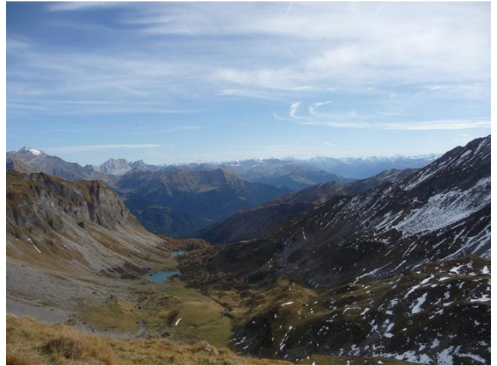
Blick oberhalb Fläscher Fürggli zu den Seen und in den Rätikon