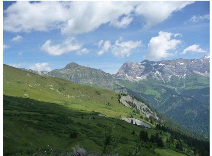
Blick nach Luvadina und in den Rätikon, links der Tschingel